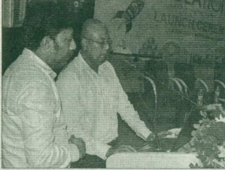
এনআৰএলৰ ষ্টাৰ্টআপ ফাণ্ডিং স্কীম 'আইডিয়েচন' মুকলিৰ মুহূৰ্ত